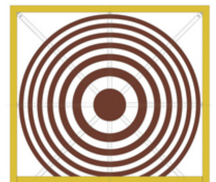
図1 音のフレネルレンズ