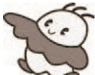
科学館マスコットキャラクター アサラ ① アストロ(宇宙) ② サイエンス(科学) ③ ライフ(生命)