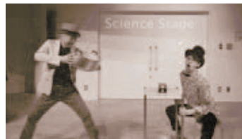
サイエンスステージ(天文館4階)