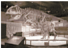
マップサウルス(生命館2階)