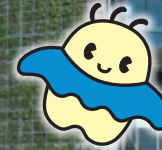
科学館マスコット キャラクター アサラ