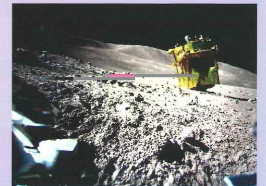
図2 LEV-2が撮影したSLIM周辺の様子

SLIMはサイズ(高さ×縦×横)が約2.4m×1.7m×2.7m、重量はわずか約200kgで、2023年9月7日に打ち上げられました。燃料を節約して月に向かうため、月でのスイングバイを活用しつつ約4ヶ月かけて軌道を調整して、12月25日に月を周回する軌道に入りました。着陸を狙ったのは「SHIOLI(シオリ)」と名付けられた直径約