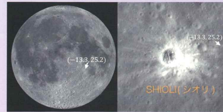
図1 SLIMが狙った着陸地点 月の南緯13.3度、東経25.2度 © NASA/LRO/JAXAに加筆修正

宇宙航空研究開発機構(JAXA)の小型月着陸実証機「SLIM(スリム):Smart Lander for Investigating Moon」が1月20日に月面への軟着陸に成功しました。旧ソ連、アメリカ、中国、インドに次いで日本は5カ国目の成功となりました。SLIMの目的は将来の月惑星探査に必要な高精度着陸技術を小型探査機で実証することです。着陸直前にメインエンジンに異常があったことが判明しましたが、その状態でも狙った場所に100m以内の精度で着陸する「ピンポイント着陸」を成し遂げました。この精度での月面着陸は世界初の快挙です。