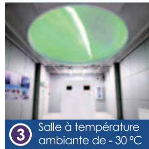
3 Salle à température ambiante de -30 °C