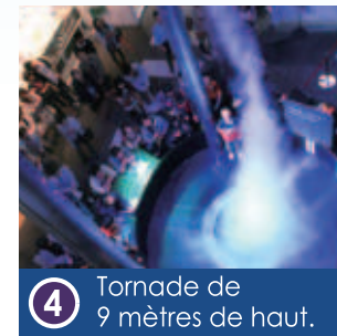
4 Tornado de 9 mètres de haut.