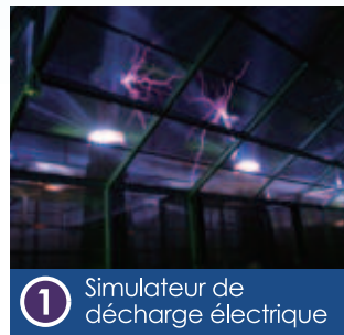
1 Simulateur de décharge électrique