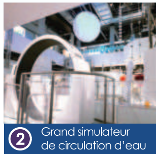
2 Grand simulateur de circulation d'eau