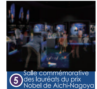
5 Salle commémorative des lauréats du prix Nobel de Aichi-Nagoya